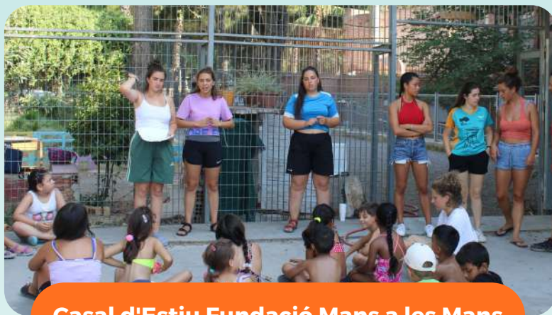
Casal d'Estiu Fundació Mans a les Mans

Es portarà a terme per als infants i adolescents d'entre 5 i 14 anys, durant 4 setmanes (del 26 al 30 de juny i del 10 al 28 de juliol). Pels joves d'entre 14 i 17 anys, tindrà lloc del 12 al 23 de juliol.