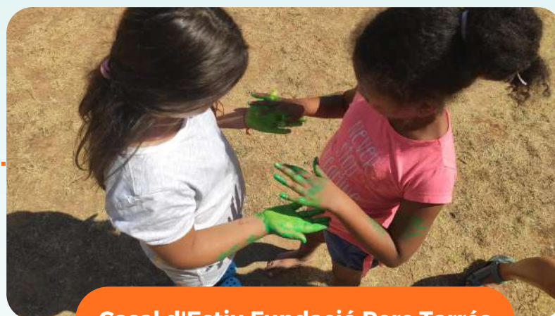
Casal d'Estiu Fundació Pere Tarrés

El Servei de Dinamització d' Imagina't , portarà a terme el Casal d'Estiu per a infants de 6 a 11 anys del 3 al 21 de juliol. Els i les adolescents gaudiran del 24 al 28 de juliol de diferents sortides i activitats.